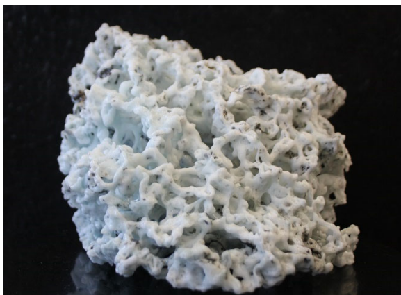
【NEO Silica メソポーラス構造標本】