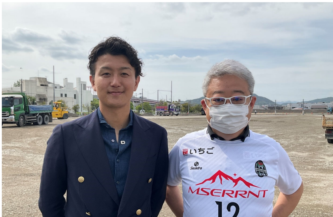
建設中のサッカーグラウンド