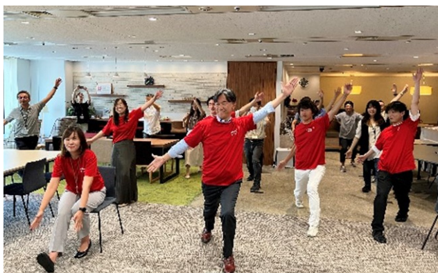
オリジナル体操「いちごゆるふわ体操」をリアル開催

また、社員同士のコミュニケーションやリフレッシュの場として作られたいちごラウンジ等では、スタンディングミーティングテーブルや、マッサージチェア、ぶら下がり健康器などを設置し、健康を推進する環境を整えています。