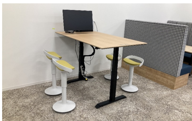
スタンディングテーブルと昇降ツール

当社では、引き続き、スポーツ支援と従業員のスポーツ活動の促進を図るとともに、サステナブルな社会を実現するための「サステナブルインフラ企業」として、当社が保有・運用する不動産に入居されるテナント様、利用される人々の生活に目を向け、人々の健康や快適性を向上させ、暮らしをより豊かなものにするための支援を行ってまいります。